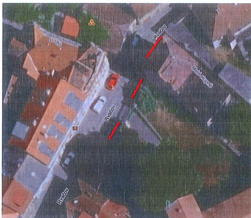
Obrázek 1 - Tři zabraná parkovací místa

Umístění značky IP12 před č. p. 113 by znamenalo, že by došlo k vyhrazení všech tří parkovacích míst, která jsou na této straně ulice u č. p. 113, 112 a 111, pro ZUŠ. K ukončení platnosti značky by došlo fakticky až s koncem ulice, jak uvádí § 3 vyhlášky č. 294/2015 Sb. vyhláška, kterou se provádějí pravidla provozu na pozemních komunikacích: „Zákaz, omezení nebo příkaz je ukončen nejbližší křižovatkou nebo příslušnou dopravní značkou.“ resp. „Platnost informativních značek označujících parkoviště končí 5 m před hranicí nejbližší křižovatky, není-li způsob a uspořádání dovoleného stání vyznačen vodorovnými dopravními značkami nebo není-li platnost informativních značek označujících parkoviště ukončena jiným způsobem.“