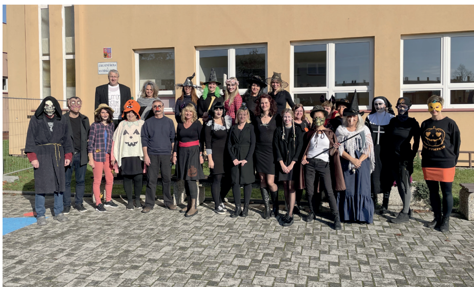
I. stupeň: 1. místo 2. B, 2. místo 3. B, 3. místo 1. C; II. stupeň: 1. místo 8. B, 2. místo 8. A, 3. místo 6. C.

Nechybělo ani hodnocení naší poroty, která se skládala ze zástupců 5. - 9. ročníků.