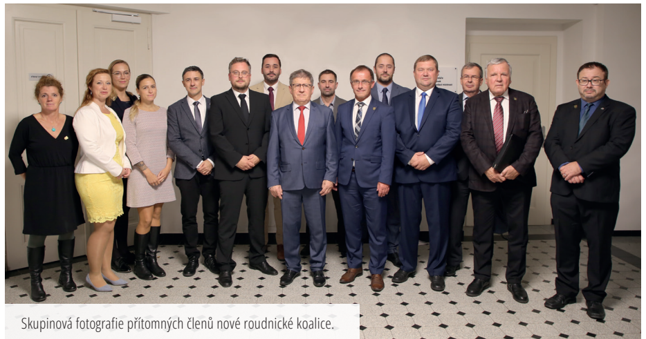
Skupinová fotografie přítomných členů nové roudnické koalice.