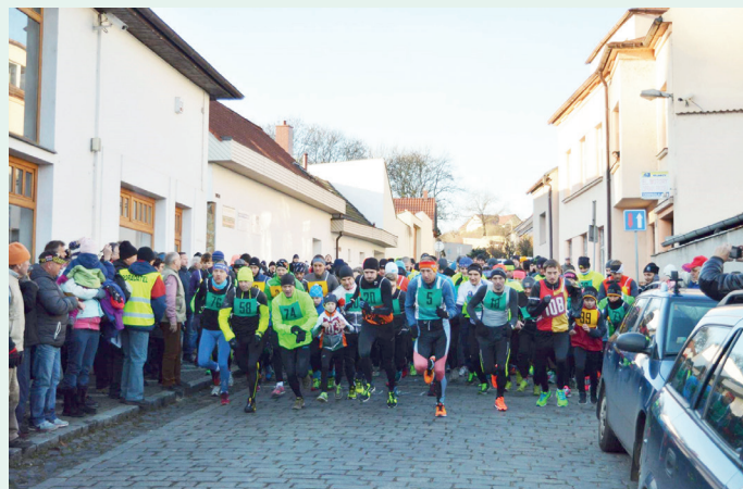
Hasa 2015 po startu