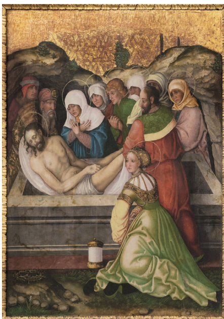
Autorem deskových maleb byl saský mistr Hans Hesse, který v době vzniku

O křížovou cestu ale nejde, přestože obrazy vyprávějí příběh Ukřižování. Obrazy pašijového cyklu byly původně součástí rozměrného křídlového oltáře, který byl široký cca 5 metrů. Jak se oltář dostal do Roudnice, nevíme, stejně tak není jasné, zda byl v Roudnici někdy instalován. Pozůstatky oltáře, tedy oněch 12 obrazů, byly nalezeny v roce 1764 na půdě zámecké jízdárny a darovány knížetem z Lobkowicz farnímu kostelu. Dílo vzniklo v roce 1522, což dokládá letopočet na odvaleném kameni Božího hrobu u závěrečné scény Zmrtvýchvstání.