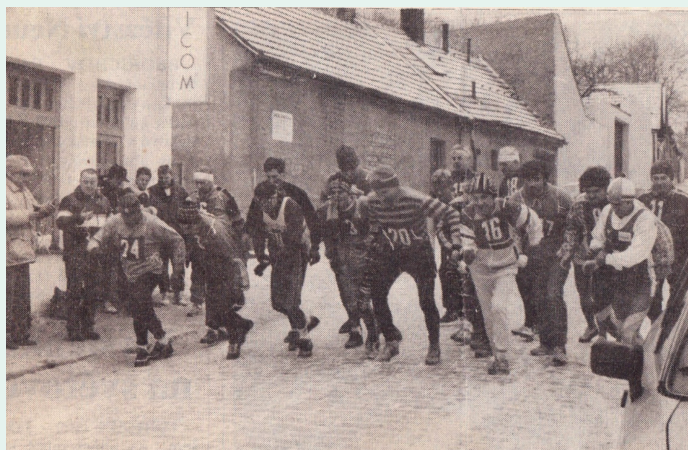
Hasa 1995 v tisku