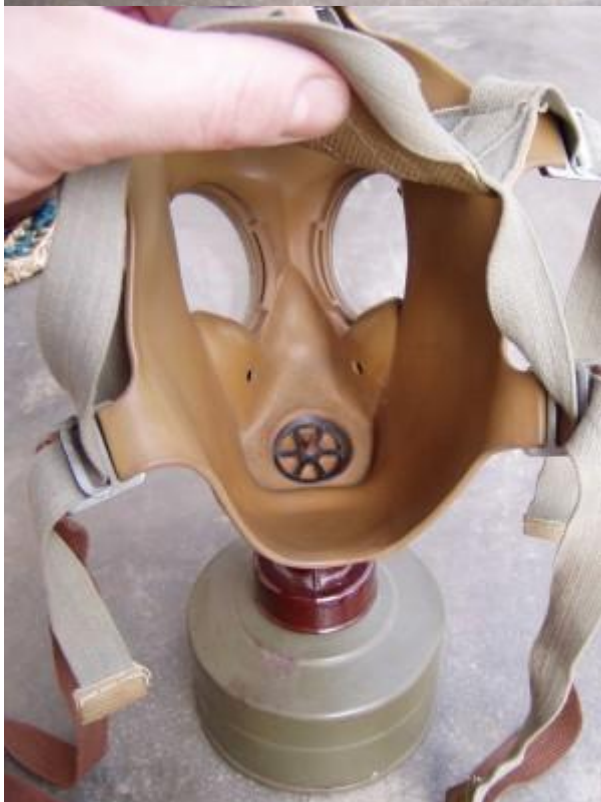
Ochranná maska CM – 3 je shodná jako CM – 3/3