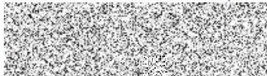
UVOK s.r.o. Zdeňka Ušáková